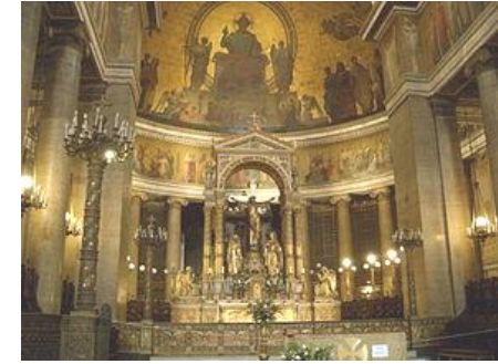
une belle église parisienne